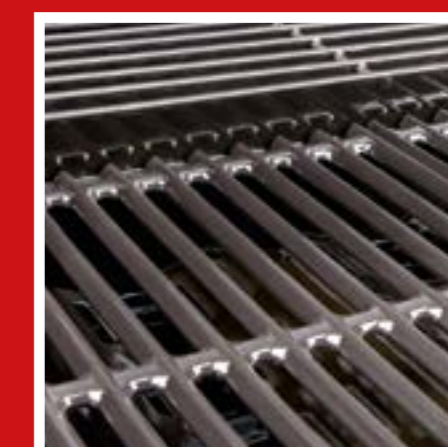
Zománcozott grillező rácsok