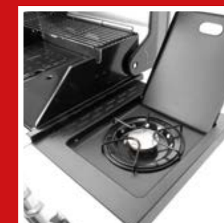
cook-zóna: körítések és szószok készítéséhez közvetlenül a grillen