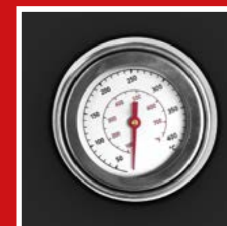
Hőmérséklet kijelző a burkolaton